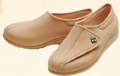
オークストレッチ