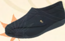
ブラックストレッチ